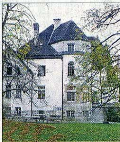
Das BAZ in St. Gilgen bietet Jugendlichen eine fachlich fundierte Ausbildung.

Durch die Umbenennung des Berufsvorschulungszentrums zum Berufsausbildungszentrum (BAZ) wird diesem neu-