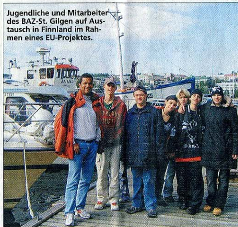
Jugendliche und Mitarbeiter des BAZ-St. Gilgen auf Austausch in Finnland im Rahmen eines EU-Projektes.

en Selbstbewusstsein auch durch den Namen Rechnung getragen. Nicht eine „Vorschulung“, sondern eine fachlich fundierte Ausbildung wird in St. Gilgen angeboten. Mit diesem Selbstbewusstsein und einer fundierten Ausbildung im Gepäck bringen die Jugendlichen zum Ausdruck: „Wir sind Teil dieser Gesellschaft, wir fordern den uns zustehenden Platz in der Arbeitswelt und wir sind bereit, auch Pflichten und Verantwortung für unser Leben mit zu tragen!“